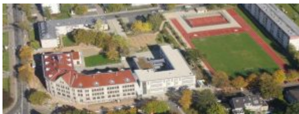
Luftbild des Gymnasiums

Wenn Dich interessiert, was an der Schule alles passiert, dann schau doch gern auf der Homepage des GAG nach. Dort findest Du z.B. im Bereich „Aktuelles“ Veranstaltungstipps sowie viele tolle Bilder von Schulgeschehen.