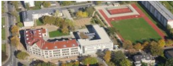
Luftbild des Gymnasiums

Wenn dich interessiert, was an der Schule alles passiert, dann schau doch gern auf der Homepage des GAG nach. Dort findest du z.B. im Bereich „Aktuelles“ Veranstaltungstipps sowie viele tolle Bilder von Schulgeschehen.